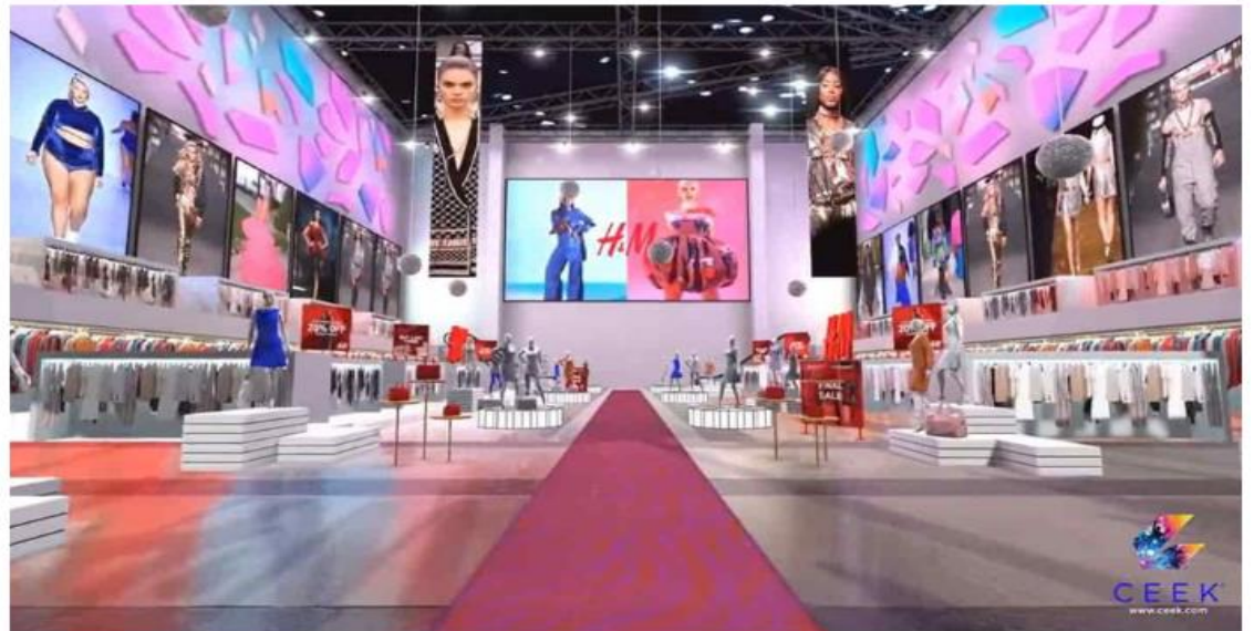
H&M 메타버스 매장

융복합된 4차 산업혁명에 고대하는 미래의 모습은 출퇴근 지옥길을 겪지 않고 공간의 물리적 한계를 넘어 메타버스 내에서 이용자간 소통하는 라이프이다. 이 공간 안에서 Chat GPT는 새로운 소통과 상호작용하는 도구가 될 것이며, 현재 다양한 분야에서 활용되고 있는 대화형 인공지능을 결합한 메타버스 내에서의 업무 방식 또한 효율적이고 간결한 처리가 가능하여 더 나은 인터랙션을 제공할 수 있을 것으로 전망한다.