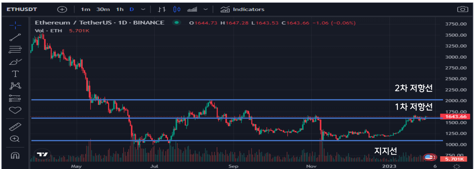
〈그림 3〉 ETH/USDT 캔들 차트