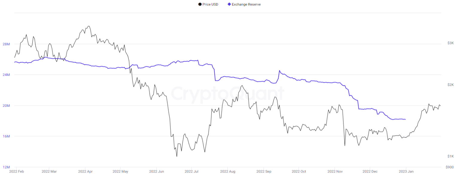
〈그림 4〉 ETH : Exchange Reserve