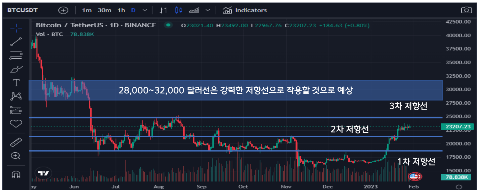
〈그림 1〉 BTC/USDT 캔들 차트