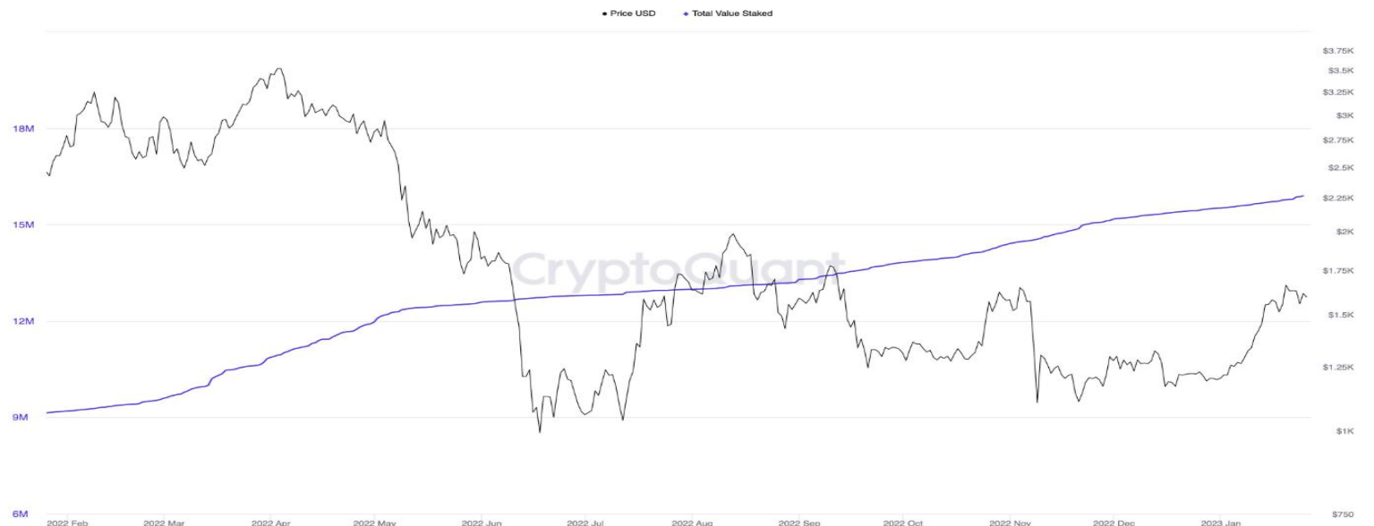
〈그림 5〉 ETH : Total Value Staked