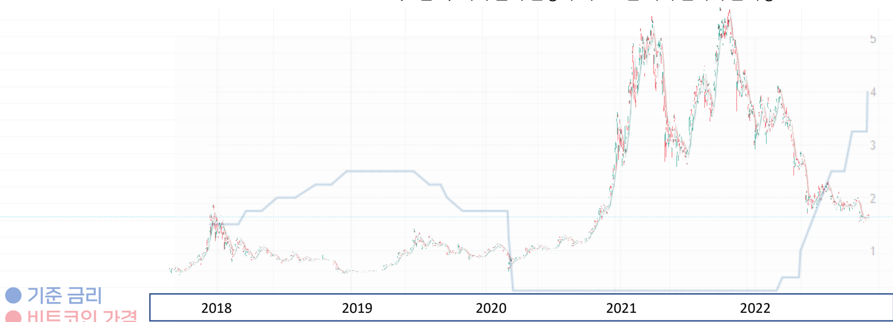
〈그림 2〉 미국 금리 인상과 비트코인 시세 변화의 관계성