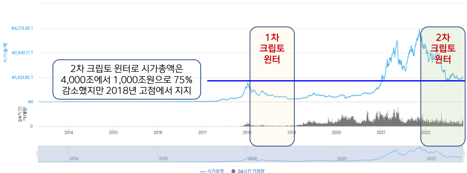
〈그림 1〉 글로벌 가상자산 시가총액