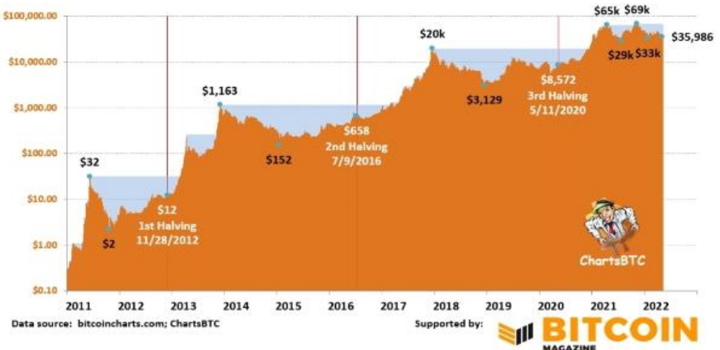
〈그림 2〉 비트코인 반감기별 가격 차트